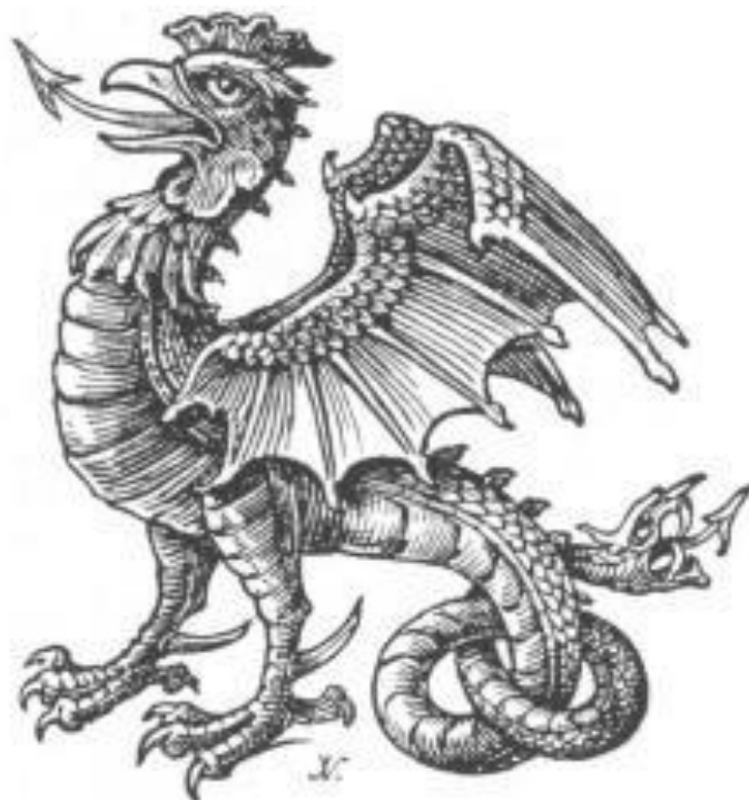
Basilisk or Amphisian Cockatrice, tail nowed.

https://www.google.com/search?q=bazyliszek++w+sztuce&source=lnms&tbn=isch&sa=X&ved=2ahUKEwiZ8f_25tToAhVynVwKHawlAv8Q_AUoAXoECAwQAw&biw=1229&bih=603